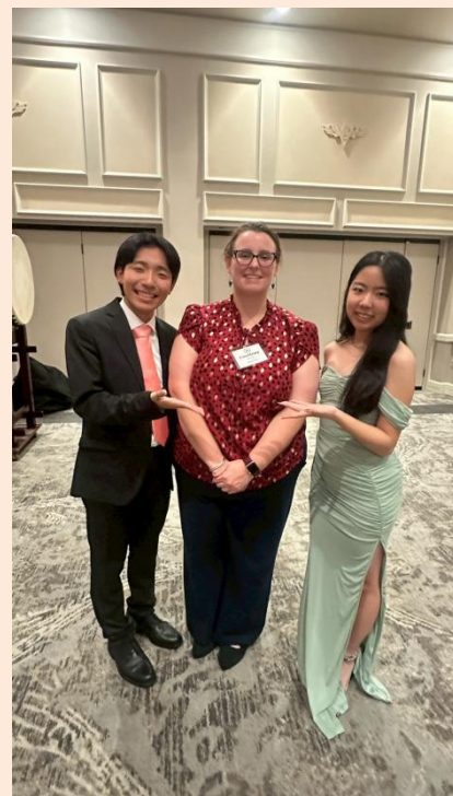
4-H留学生の中から選ばれて招待された ラボ38期生のふたり 4-H全国会議(2025.11月)・シアトル