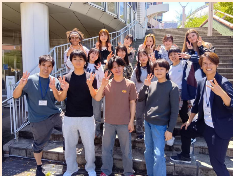
第39期生・全国事前研修合宿(2025.5月・東京)